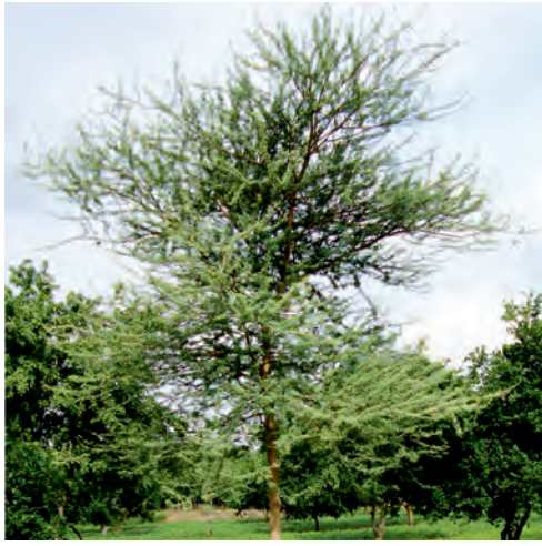
कुमट आधारित कृषिवानिकी

बुंदेलखण्ड क्षेत्र में कुमट आधारित कृषिवानिकी एव गम अरेबिक की पैदावार बढ़ाने के लिए केन्द्रीय कृषिवानिकी अनुसंधान संस्थान, झांसी द्वारा भारतीय कृषि अनुसंधान परिषद्, नई दिल्ली द्वारा वित्त-पोषित 'प्राकृतिक रॉल एवं गोंद की कटाई, प्रसंस्करण एवं मूल्य संवर्धन' नेटवर्क परियोजना के अन्तर्गत शोध किया जा रहा है। इस परियोजना का मुख्यालय प्राकृतिक रॉल एवं गोंद अनुसंधान संस्थान, रांची, झारखण्ड है। इस परियोजना के तहत कुमट आधारित कृषिवानिकी प्रारूप का विकास किया जा रहा है। इसकी जानकारी कृषकों को दी जाती है, जिससे ज्यादा से ज्यादा कृषक कुमट आधारित कृषिवानिकी अपनाने में सफल हों। कुमट का वृक्षारोपण तीन तरीके से किया