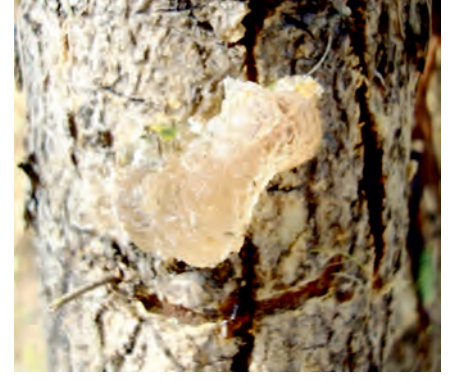
कुमट से गोंद का स्रवण

बुंदेलखण्ड में कुमट की बढ़ोतरी एवं इससे उत्पादित होने वाली गोंद की उपज पर अध्ययन हेतु केन्द्रीय कृषिवानिकी अनुसंधान संस्थान, झांसी द्वारा कुमट आधारित कृषिवानिकी प्रारूप का विकास किया गया है। अध्ययन से यह पता चला कि वृक्षारोपण के 7 वर्ष बाद कुमट के पौधों की जीवितता शोध प्रक्षेत्र पर 86-96 प्रतिशत रही, जबकि कृषकों के खेतों पर 54-78 प्रतिशत रही। शोध प्रक्षेत्र पर कुमट के वृक्ष की ऊंचाई एवं मोटाई क्रमशः 3.3-4.6 मीटर एवं 9.2-26.0 सें.मी. पायी गई जबकि कृषकों के खेत पर ऊंचाई 2.3-3.5 मी. एवं मोटाई 6.1-22.0 सें.मी. पायी गई। आंकड़ों से पता चलता है कि कुमट की वृद्धि कृषकों के खेतों पर शोध प्रक्षेत्र की अपेक्षा कम रही। इसका मुख्य कारण अन्ना प्रथा के चलते खुले जानवरों द्वारा पौधों को दबाना, कुचलना एवं चरना है। शोध से यह भी ज्ञात हुआ है कि राजस्थान के शुष्क क्षेत्रों की अपेक्षा कुमट की वृद्धि बुंदेलखण्ड क्षेत्र में अच्छी होती है।