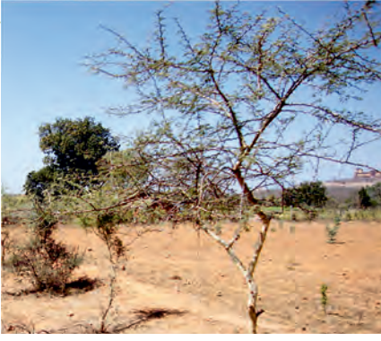
खेत की मेड़ पर कुमट का रोपण

बुंदेलखण्ड में कुमट के वृक्ष से रोपण के 5 वर्ष पश्चात् ही गोंद का निकलना आरंभ हो जाता है। झांसी स्थित केन्द्रीय कृषिवानिकी अनुसंधान संस्थान में स्थापित कृषिवानिकी प्रारूप में कुमट के 5 वर्ष के वृक्ष से गोंद की औसत उपज 38.2 ग्राम प्रति वृक्ष प्राप्त हुई, जबकि 6 वर्ष वाले वृक्षों से औसतन 58.7 ग्राम गोंद प्रति वृक्ष प्राप्त हुआ। इसके विपरीत कृषकों के खेतों पर लगाये गये कुमट के वृक्षों पर गोंद का निकलना 7 वर्ष की आयु में देखा गया। इससे यह स्पष्ट है कि यदि सही रखरखाव किया जाये तो कुमट के वृक्ष से रोपण के 5-6 वर्षों बाद गोंद मिलना शुरू हो जाता है। ऐसा अनुमान है कि 12 से 15 वर्षों के पश्चात् एक परिपक्व कुमट के वृक्ष से औसतन 250 ग्राम गोंद प्रति वर्ष प्राप्त हो सकता है। यदि एक कृषक अपने खेत में 10×10 मीटर की दूरी पर अथवा मेड़ पर 100 कुमट के वृक्ष लगाये एवं गोंद की उपज को 500 रुपये प्रति कि.ग्रा. की दर से बेचे तो उसकी वार्षिक आमदनी में लगभग 12500 रुपये की बढ़ोतरी हो जायेगी। कुमट के गोंद का रिसाव अक्टूबर-नवम्बर एवं मार्च-अप्रैल में होता है। गोंद के रिसाव को प्राप्त करने के लिए कुमट के वृक्षों में हल्की छंटाई की जाती है। छंटाई के 30-40 दिनों के पश्चात् गोंद रिसता है, जो बाद में सूखकर सख्त हो जाता है। यह गोंद वृक्ष से अलग करके एकत्र कर लिया